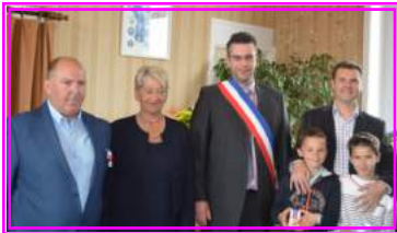
Médailles du travail