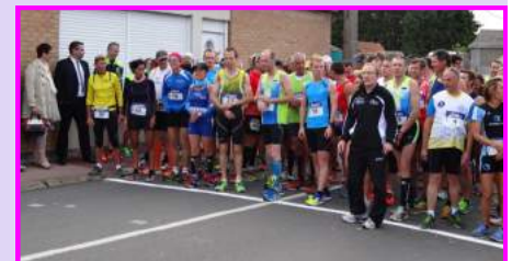
Course des Joggeurs