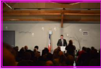
Cérémonie des vœux de la commune