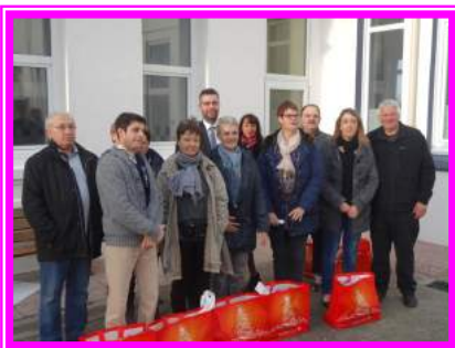
Distribution des colis aux aînés