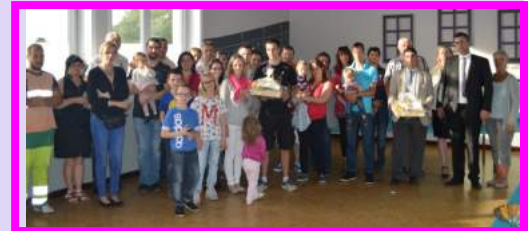
Accueil des Nouveaux Habitants