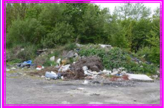
Déchets rue du Lac ramassés par nos agents

Par ailleurs, l'abandon de l'épave d'un véhicule est puni de 1500€ d'amende, tout comme le dépôt de déchets transportés à l'aide d'un véhicule.