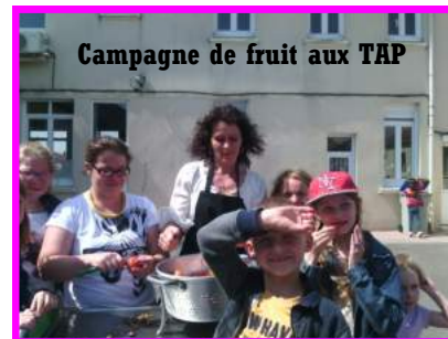
Campagne de fruit aux TAP