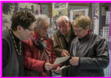
Guemps au fil du temps