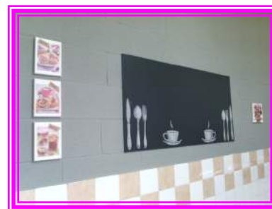
Réfection de la cantine